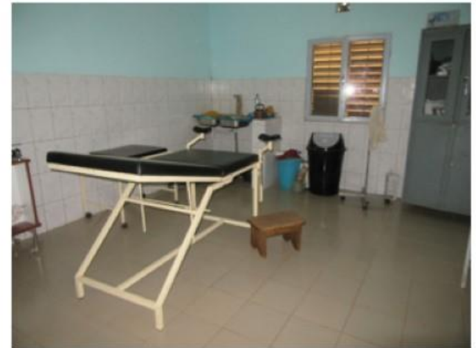
La maternité - salle d'accouchement