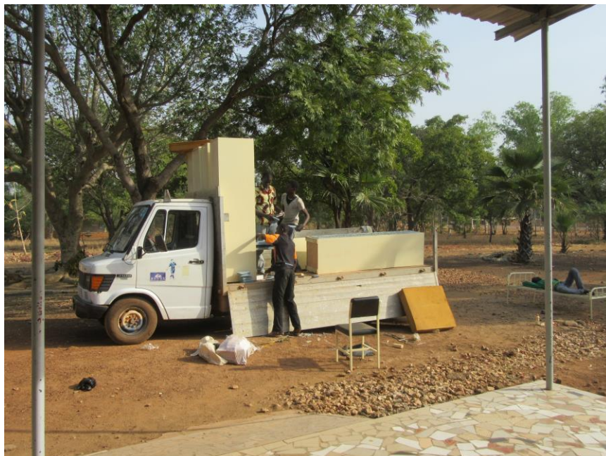
Arrivée des meubles