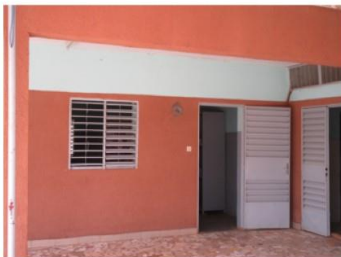
L'entrée de la pharmacie : les persiennes en métal laissent passer la chaleur et la poussière