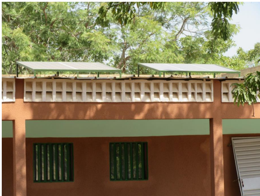
Pose de panneaux solaires