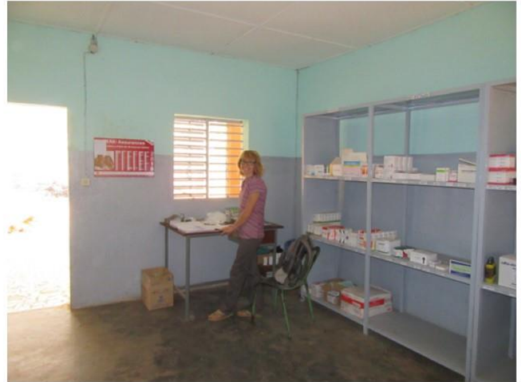
Réorganisation du local et des outils de travail