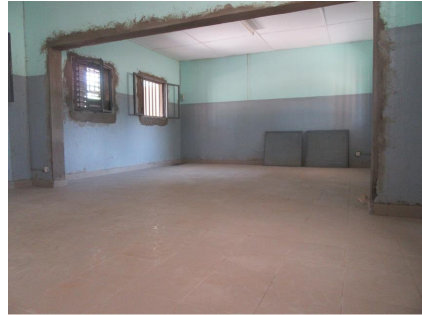
Pose du carrelage