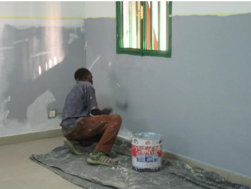
Peinture des murs