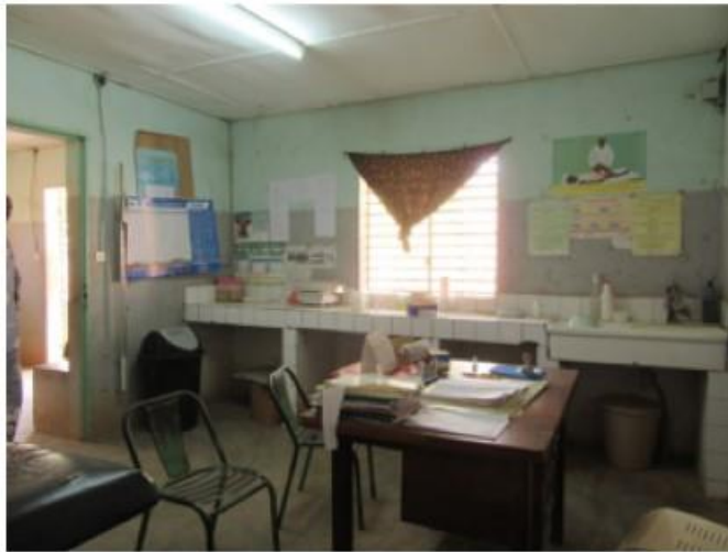
Le centre de consultation