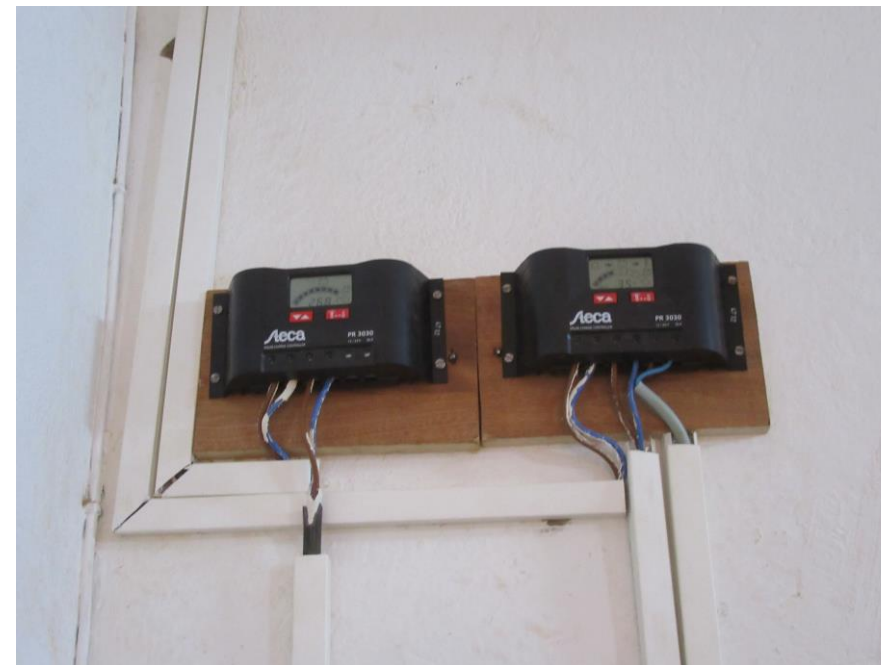
Régulateur de charge solaire