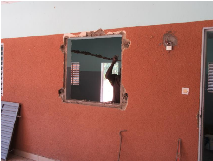
Retrait des grilles