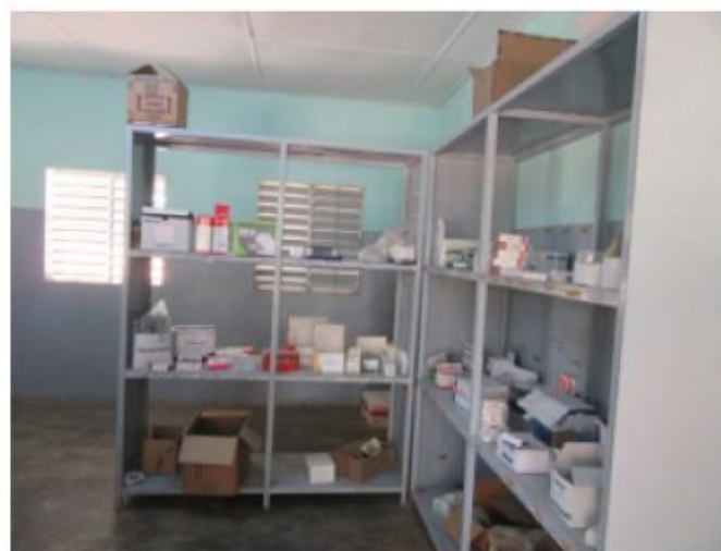
Le stock de médicaments : les produits sont entreposés sans ordre ni classement