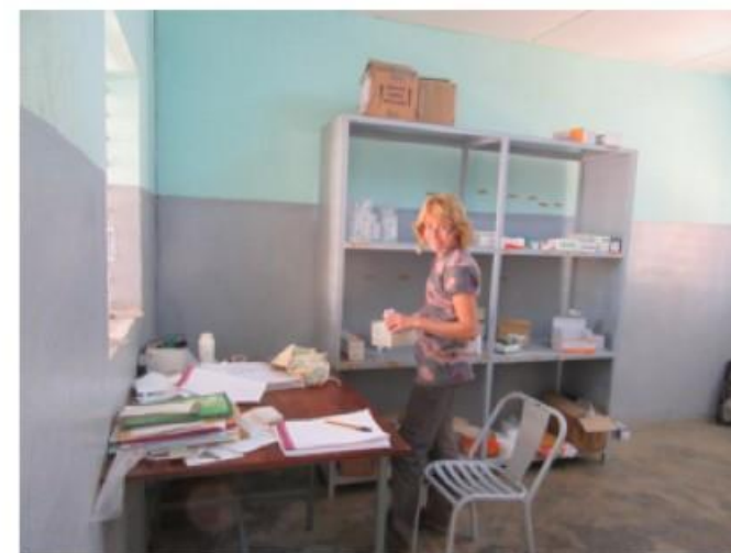
Le bureau de la pharmacie