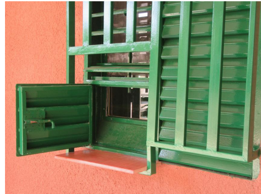
Pose d'un guichet