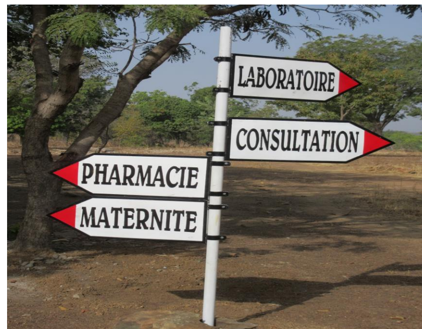
Panneaux de signalisation des différents services